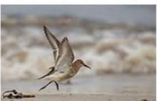
5_Karin Koopman 10 ptn