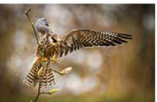
17_Frans Snoeijs 13 ptn