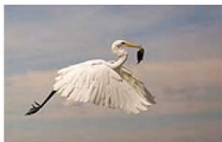
1_Mary Thoms 12 ptn