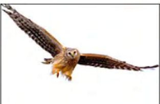
19_Ben Dalsheim 9 ptn