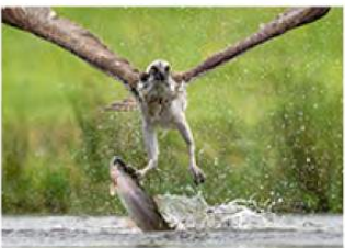
13_Inge Duijsens 11 ptn