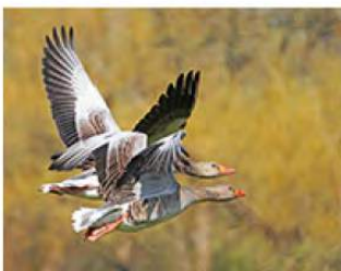
11_Jeanne de Jong 10 ptn