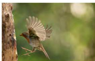
2_Rob Boehle 9 ptn