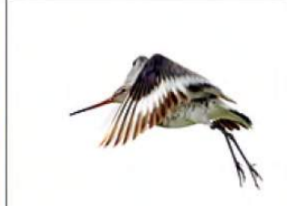
16_Huib Limberg 8 ptn