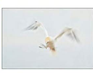
12_Gina Heynze 13 ptn