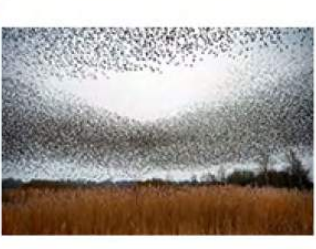
10_Franke de Jong 12 ptn