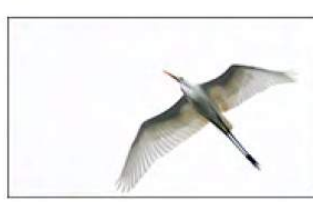
3_Rob Boehle 12 ptn