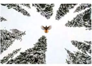
14_Cladia van Zanten 12 ptn