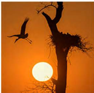
20_Dick Pasman 12 ptn