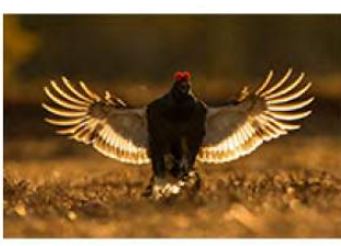
15_Inge Duijsens 15 ptn