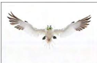
7_Martina van Raad 13 ptn